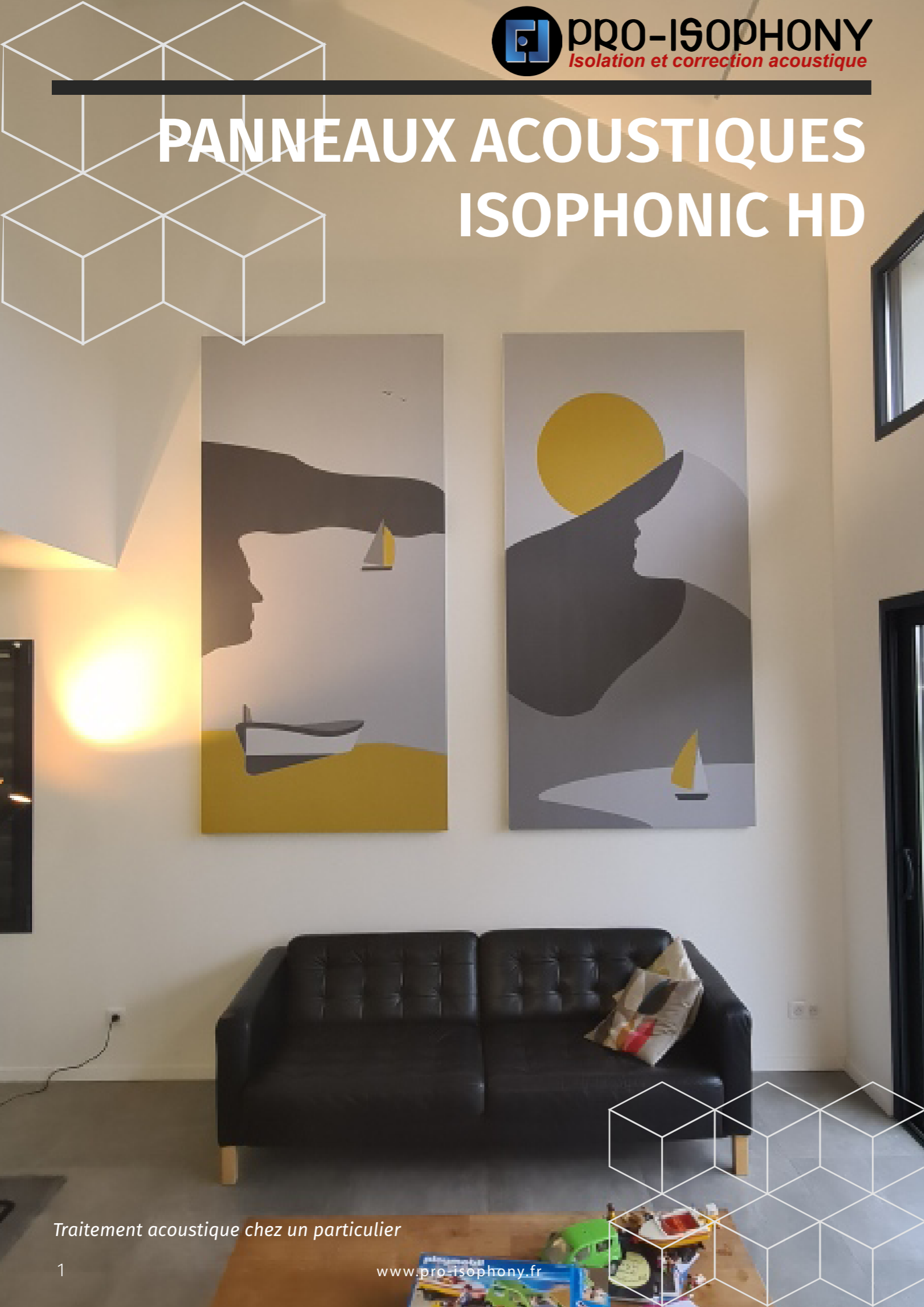
Traitement acoustique chez un particulier